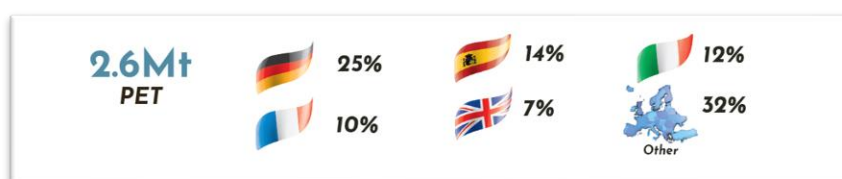
Figura 2 - Country with the highest installed recycling capacity per polymer type - Fonte: Report on Plastics Recycling Statistics 2020

Da uno studio condotto si evidenzia che, purtroppo, ad oggi la quasi totalità delle imprese coinvolte nel processo di riciclo di materiale plastico (tra cui anche il PET) non redigano alcun report di natura non finanziaria. Coripet sta valutando di integrare al suo interno un sistema di report di natura non finanziaria che permetterà di arrivare ad un vero e proprio Bilancio di sostenibilità, anche in virtù dell'obbligo della Tassonomia Europea che permetterà di classificare gli investimenti ritenuti sostenibili in Europa dal punto di vista ambientale. Tutto ciò a seguito della sottoscrizione da parte dell'EU del Green Deal Europeo che detta la strategia per le società per diventare a impatto climatico "0" entro il 2050. In poche parole la tassonomia serve a dire agli investitori cosa sia realmente green.